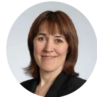
Замглавы Минобрнауки России Петрова О.В.

Реализуемая система федеральных инновационных площадок Минобрнауки России сегодня оказывает всестороннюю поддержку педагогическому сообществу – реализуемая инновационная площадка выступает организатором профессиональных конкурсов и мероприятий, разрабатывает педагогические учебники и пособия, оказывает информационную, правовую, методическую и информационную поддержку работникам образования и реализует и иные важные задачи в системе образования.