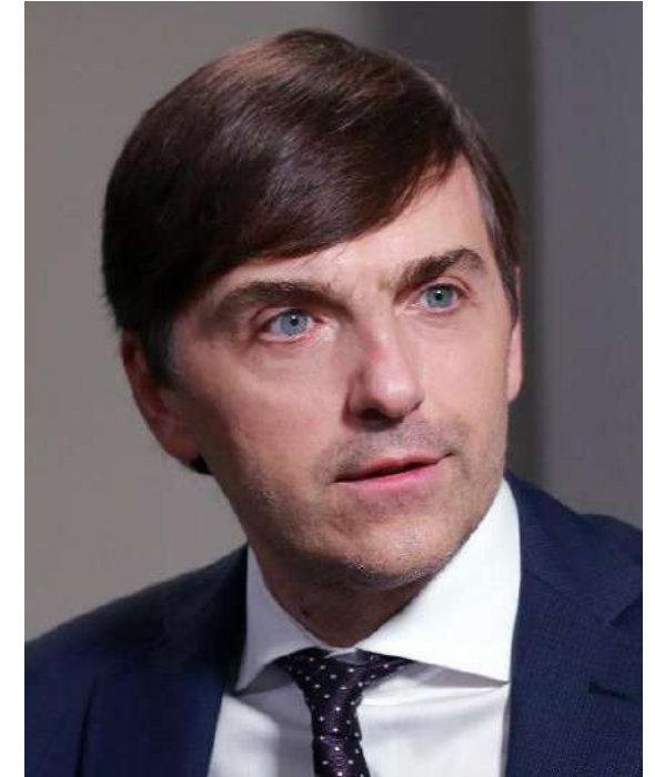
Министр просвещения РФ Сергей Кравцов