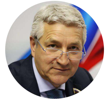
Первый заместитель председателя комитета Государственной Думы по охране здоровья Леонид Анатольевич Огуль

Мы призываем педагогическое сообщество активно сотрудничать с медицинскими специалистами, чтобы все учителя обладали необходимыми навыками и знаниями в области оказания первой медицинской помощи. Ведь это не просто полезный навык — это то, что может спасти человеческую жизнь в экстренной ситуации, когда счет идет на секунды.