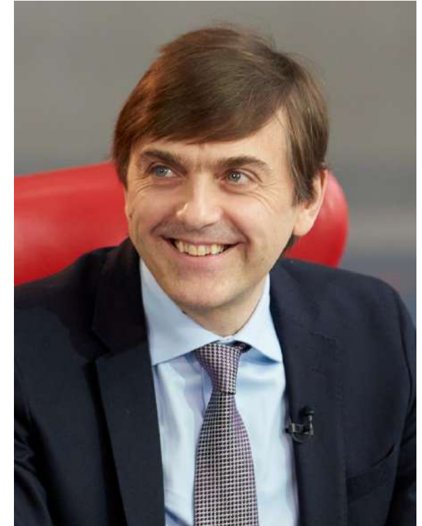
Министр просвещения РФ Сергей Кравцов

Следующее направление – современная инфраструктура, созданная в том числе в рамках национального проекта «Образование». Строятся и ремонтируются школы и детские сады, в также открыты 79 региональных центров, работающих по модели «Сириус», открыто более 250 центров «IT-куб», 365 технопарков-кванториумов, а также более 17 тысяч центров образования цифрового, естественнонаучного, технического, гуманитарного профиля «Точки роста».