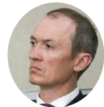
Вице-премьер РФ — руководителя аппарата Правительства Дмитрий Григоренко

Ранее из-за отсутствия финансирования школы и другие бюджетные учреждения могли «не соблюдать какие-то правила», а потом в рамках проверок надзорные государственные органы «наказывали самих себя, вынося штрафы» Это выглядело странно. Мы решили эту задачу, как обещали, у нас на сегодняшний день такие проверки запрещены, это все переведено в режим профилактики, которая запрещает штрафовать, но при этом дает рекомендации на предмет выявления нарушений и исправления, если такие есть